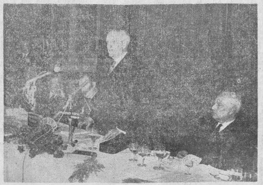
La gran cruz del Mérito Civil al director de ABC de Sevilla

Asimismo, Hassan ha anunciado que se organizarán exequias que serán presididas personalmente por él y que se rendirán los honores debidos a su rango y prestigio.