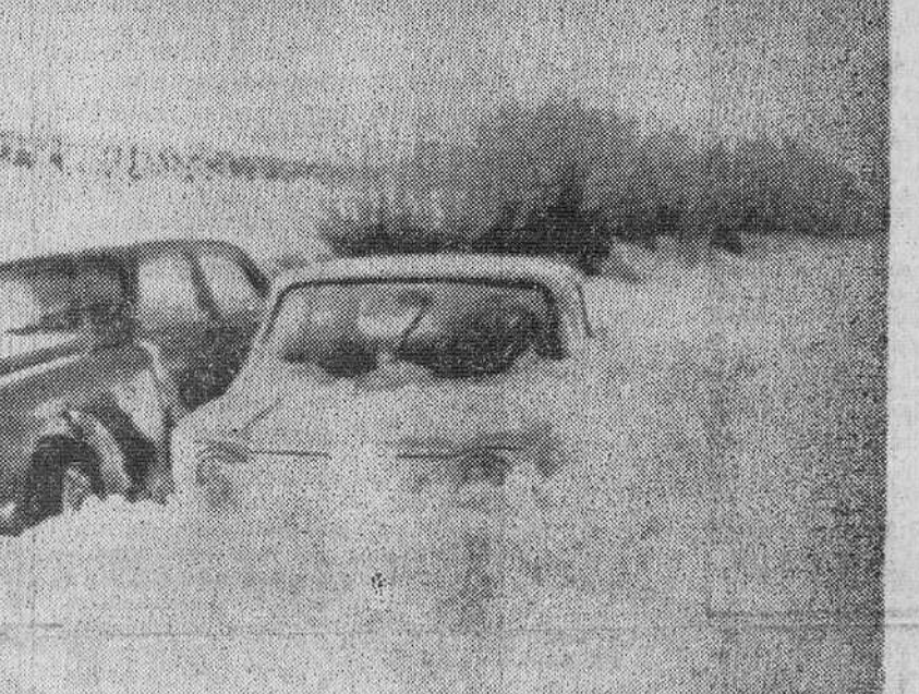
Boulou (Francia). — Las grandes nevadas han dejado la carretera nacional número nueve impracticable, en el tramo Perthus-Perpignan. En la foto dos auto móviles materialmente sepultados.