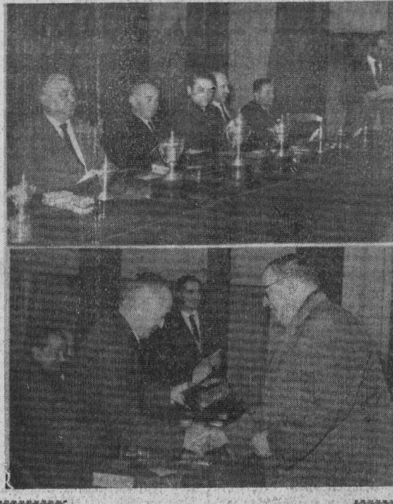
En la parte superior del grabado, presidencia del acto de entrega de premios y trofeos, a las parejas y sociedades clasificadas en el IV Campeonato de juego de mus, organizado por la Caja de Ahorros Municipal.

En las Escuelas Profesionales Femeninas establecidas en la barriada Juan Yagüe