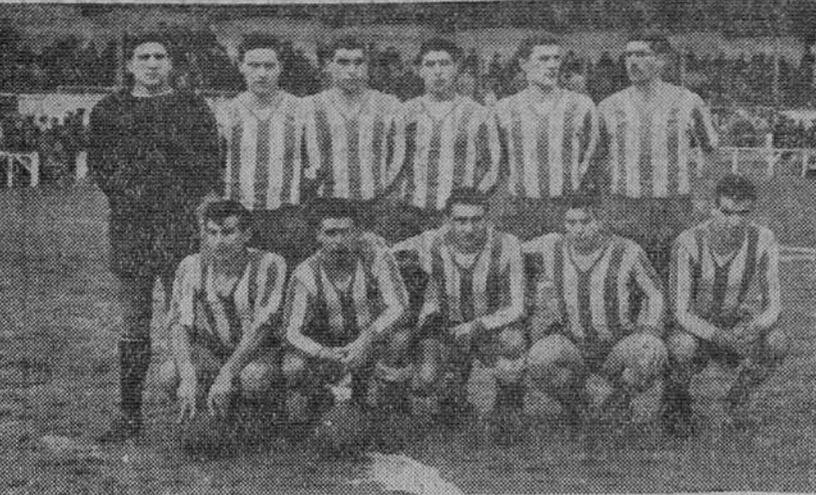
El Alavés, tal y como se alineó anteayer frente al Burgos, que lo derrotó mercedemente, por tres-cero.

Hay equipos de los que ya se tiene formado un concepto, en razón del cual se juzgan las posibilidades del nuestro a la hora de enfrentarse con ellos... Burgos, en la última jornada, estamos seguros de que eran mayoría los aficionados que temían digamos mejor temíamos— el choque con el Alavés.