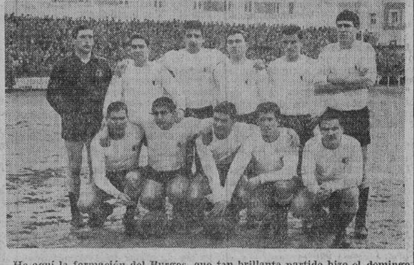
He aquí la formación del Burgos, que tan brillante partido hizo el domingo en Zatorre.

El Alavés, tal y como se alineó anteayer frente al Burgos, que lo derrotó mercedemente, por tres-cero... Burgos, en la última jornada, estamos seguros de que eran mayoría los aficionados que temían digamos mejor temíamos— el choque con el Alavés.