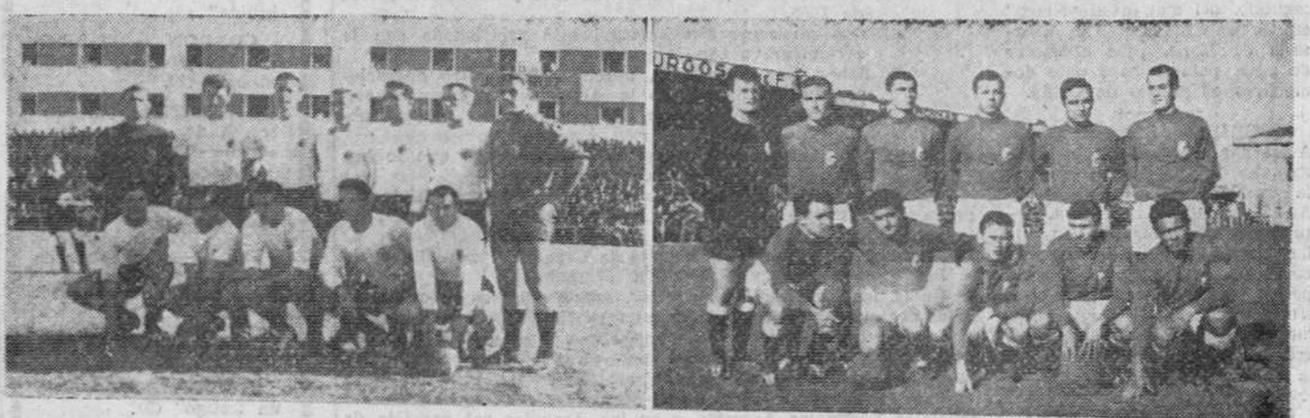
El domingo último dió comienzo, en toda España, el torneo de Liga, iniciándose con ello las competiciones de fútbol. El primer partido oficial de la temporada se jugó el domingo en Zatorre. He aquí los equipos del Burgos y Constancia alineados poco antes de comenzar el encuentro, que terminó con la victoria local por cuatro a uno.