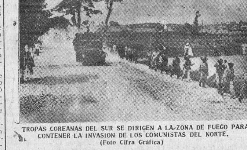
TROPAS COREANAS DEL SUR SE DIRIGEN A LA ZONA DE FUEGO PARA CONTENER LA INVASION DE LOS COMUNISTAS DEL NORTE.

Violenta batalla en la ribera del río Kum