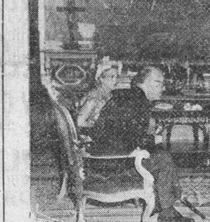
MADRID.—S. E. EL JEFE DEL ESTADO ACOMPAÑADO DE MR. FLOYD B. ODLUM, PRESIDENTE DE "ATLAS CORPORATION" Y DE LA ESPOSA DE ESTE, MRS. JACQUELINE COCHREN, A QUIENES RECIBIO EN EL PALACIO DE EL PARDO