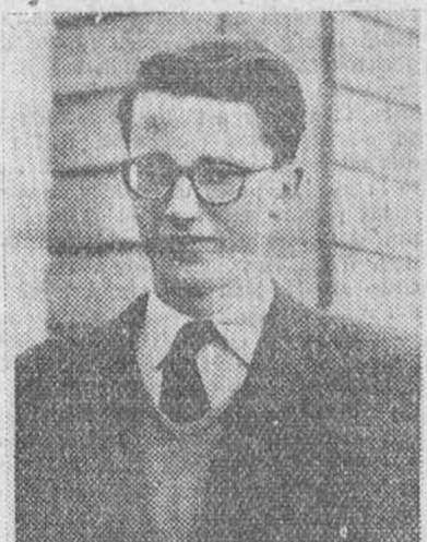
EL PRINCIPE GALDUINO, HIJO DEL REY LEOPOLDO DE BELGICA.

Bruselas.—Los poderes que el Rey Leopoldo transmitirá a su hijo, el Príncipe Balduino, son teóricamente mayores que los del Monarca inglés y menores que los del presidente norteamericano.