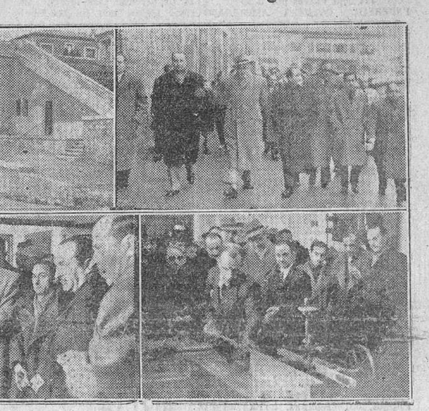
En el día de ayer y en el pintoresco pueblo de Quintanar de la Sierra, se celebraron solemnes actos con motivo de la inauguración oficial de la Escuela-Taller de Carpintería y Ebanistería establecida por la Obra Sindical de Formación Profesional.

Previamente y a media mañana, las jerarquías sindicales llegadas de Madrid, visitaron el edificio de la C.N.S. provincial. Poco después emprendieron la marcha y sobre las doce y media del mediodía hacían su entrada en Quintanar junto con las autoridades burgalesas.