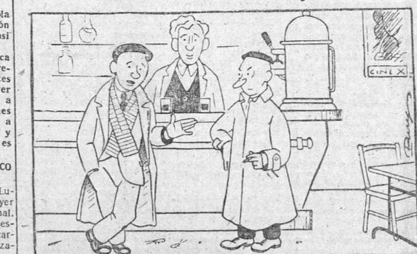
—No parece haber buenas impresiones respecto al arriando de la plaza de toros... — Pues no lo entiendo, porque una plaza de toros siempre es un negocio redondo.