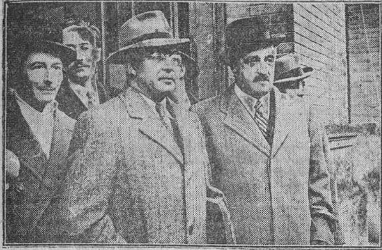
Madrid. — El doctor Hertzog, acompañado del primer introductor de Embajadores Barón de las Torres momentos después de su llegada a esta capital, por la estación de Atocha.