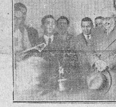
En nuestro reportaje gráfico, aspecto de la Escuela-Taller en inaugurada en Quintanar; las autoridades y jerarquías, en el mencionado pueblo; momento de la ceremonia de bendición y un aspecto parcial de la Escuela-Taller, en pleno funcionamiento durante la visita efectuada por las personalidades concurrentes al acto.

En el día de ayer y en el pintoresco pueblo de Quintanar de la Sierra, se celebraron solemnes actos con motivo de la inauguración oficial de la Escuela-Taller de Carpintería y Ebanistería establecida por la Obra Sindical de Formación Profesional.