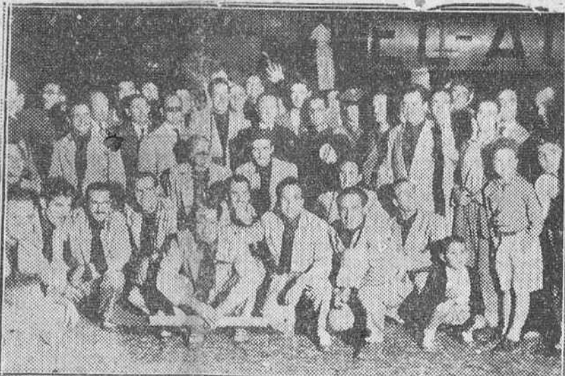
MADRID. — LOS ESTUDIANTES ESPAÑOLES QUE HICIERON LA TRAVESIA PALMA DE MALLORCA-ROMA EN PIRAGUA, PARA GANAR EL AÑO SANTO, A SU LLEGADA AL AERODROMO DE BARAJAS, DONDE FUERON RECIBIDOS POR EL MINISTRO DE JUSTICIA Y OTRAS JERARQUÍAS DEL S. E. U.