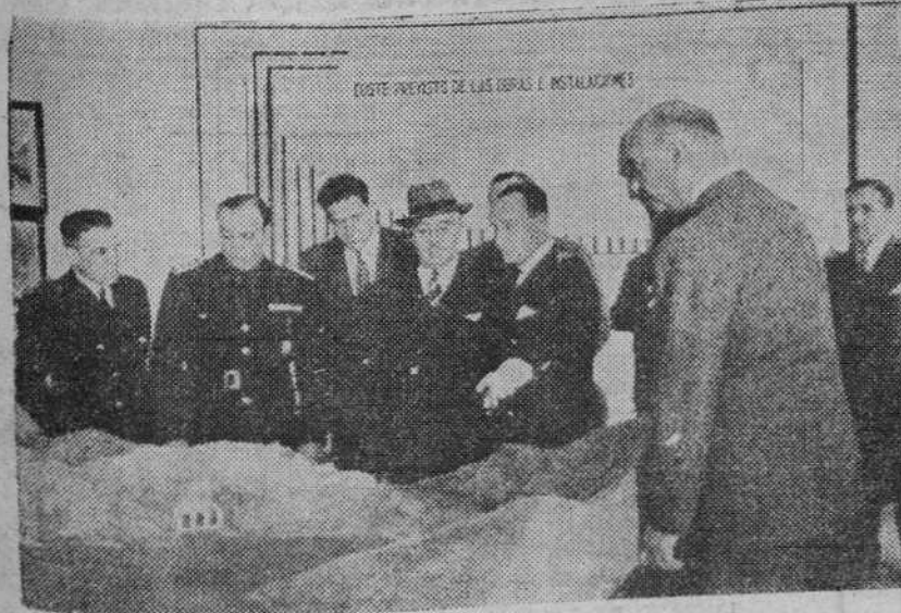
El Generalísimo visita la exposición de maquetas del nuevo abastecimiento de aguas en Sevilla.