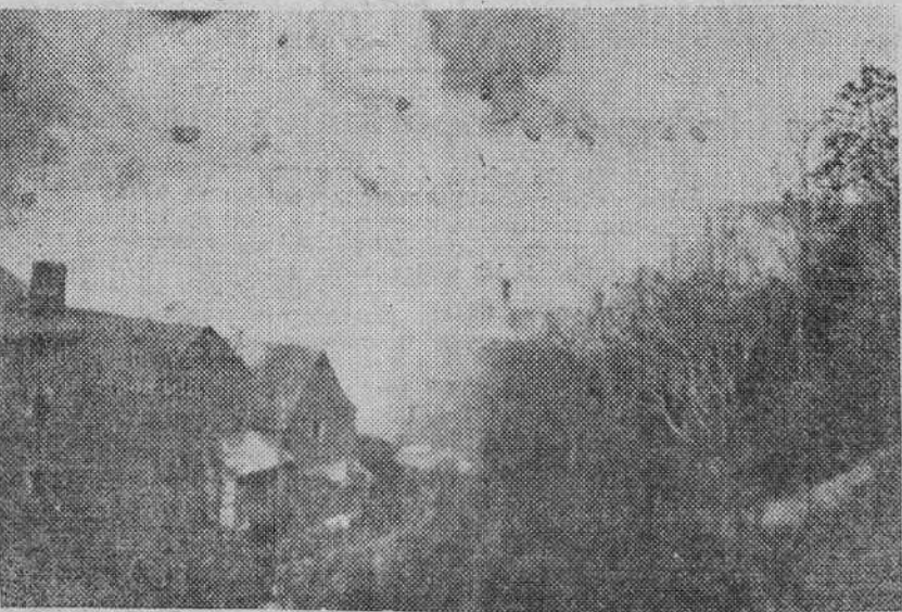
A las diez de la noche el incendio dominaba por completo el pueblo y de nada servían los auxilios de todos

Los servicios de bomberos de Huesca y Jaca que pronto aparecieron en Canfranc, ni siquiera pudieron actuar. El viento impedida su acción. De la rapidez del incendio da idea el que éste se propagara a la totalidad del pueblo en dos horas y media. La velocidad del viento era grande. Así, poco era posible hacer. Los hombres se mordían los puños de rabia ante la impotencia de los servicios contra los elementos. Era imposible intentar nada y había que dejar terminar su destructora acción a las llamas. A la una y media de la madrugada, el aire se enfureció más, las chispas llegaron en imponente profusión a los montes cercanos, prendiendo en algunos puntos. Se temió en los primeros instantes que el fuego adquiriera así nuevos y lamentables derroteros. Pero merced al estado de verdor del campo no tuvieron confirmación los temores que se abrigaron en este aspecto.