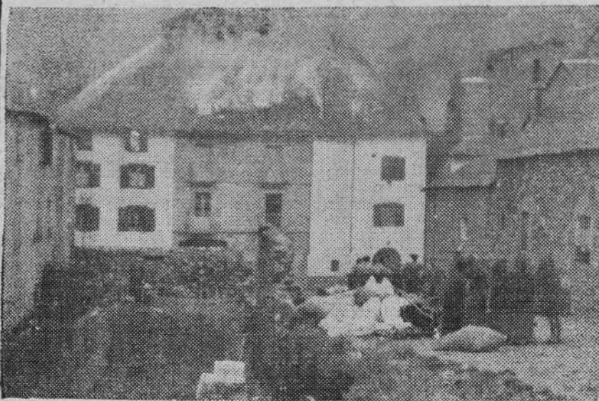
El panorama era desolador: por todas las partes, en carreteras y calles, sacos de harina, animales, enseres de hogar, montones de forraje...