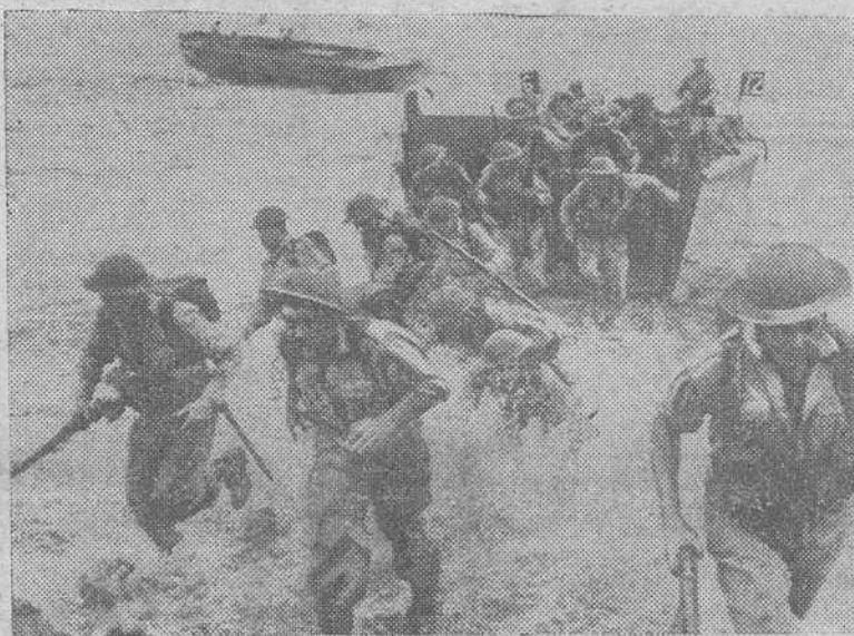
Soldados neozelandeses haciendo prácticas de desembarco en una isla del Pacífico