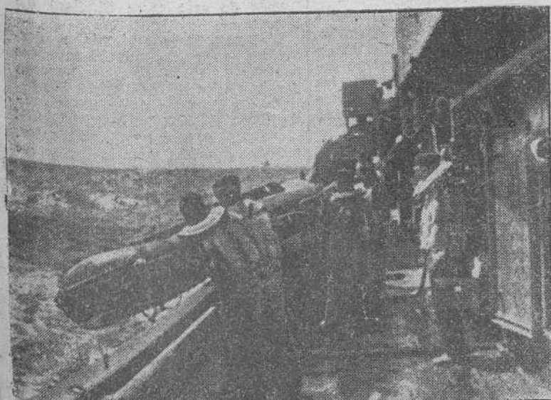
En un patrullero alemán, un tripulante ha resultado herido en acción de guerra. Rápidamente se arria un bote para ir en busca de auxilio médico en otro patrullero próximo

3.251 millones ha invertido España en la creación de nuevas industrias