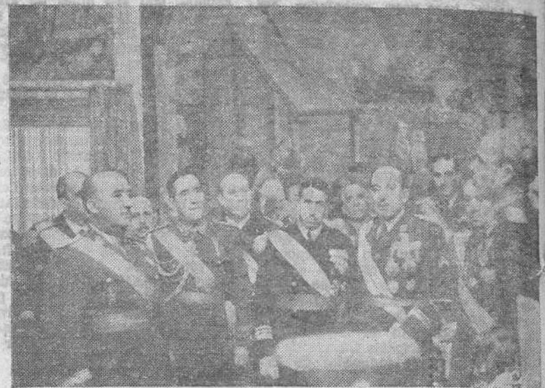
Con ocasión de celebrarse la tradicional Pascua Militar, los Ejércitos de Tierra, Mar y Aire ofrecieron a S. E. el Jefe del Estado y Generalísimo un bastón de mando y un album que contiene las firmas de los ministros y de todas las jerarquías militares. He aquí el ministro del Ejército efectuando la ofrenda.

Doce meses y nueve días duró la batalla de Teruel y en ella sufrieron los rojos más de 60.000 bajas. La posición de Teruel era un milagro en la heroica geografía del frente nacional. Rodeado por casi todas partes de posiciones marxistas sólo