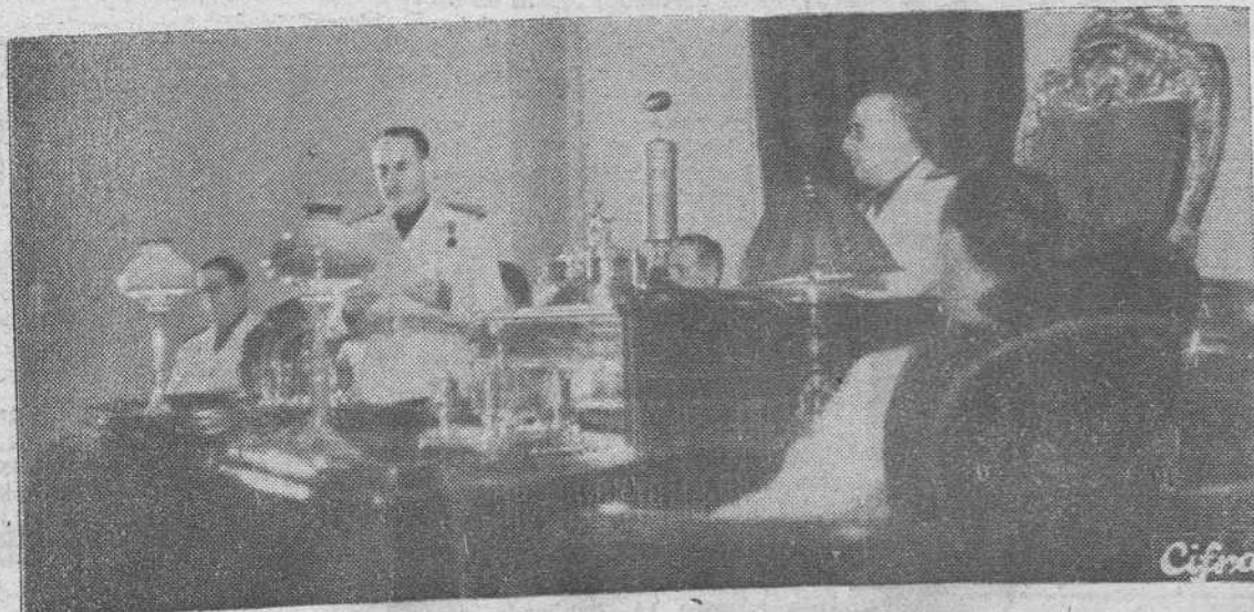
S. E. el Jefe del Estado presidiendo la sesión de clausura de la reunión de jefes provinciales, celebrada a finales del pasado año