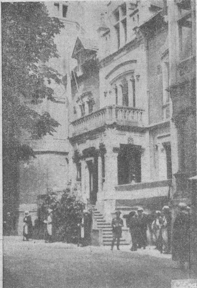
El Palacio de la Isla, en nuestra ciudad, que fué residencia de S. E. el Jefe del Estado Generalísimo Franco, durante la Cruzada y actualmente declarado monumento histórico