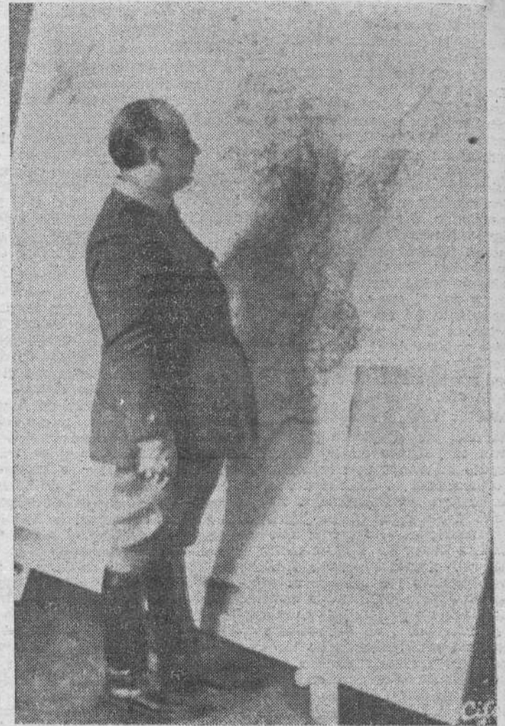
El jefe del Estado, Generalísimo Franco, en su Cuartel general de Burgos, ante el mapa de operaciones a través del cual condujo a los Ejércitos nacionales a la Victoria

En una de las esquinas se encuentra sobre un caballete el último mapa de operaciones que contempló la mirada del Cudillo. Tiene unos dos metros de alto por casi dos de ancho. En él aparecen di-