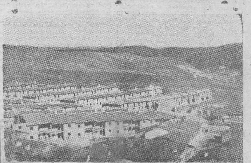
Arriba.—Ruinas, miseria y abandono absoluto significa el antiguo pueblo de San Leonardo de Yagüe de la provincia de Soria. Abajo.—Alegria, luz y bienestar refleja el nuevo pueblo levantado por la política redentora de Franco.

des nacionales en el escaso espacio puesto es suficiente para demostrar la que disponemos para este trabajo, obra magnífica de reconstrucción nacional que se realiza en España bajo el mando del Caudillo, que encuentra fe y confianza en todos los españoles.