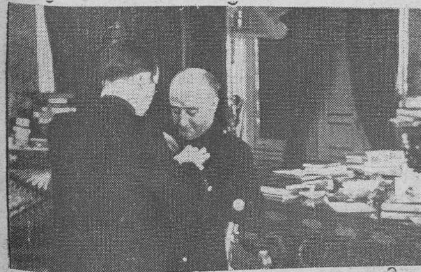
Arriba, el sabio español Doctor Jiménez Díaz, es recibido en audiencia por Su Excelencia el Jefe del Estado. Abajo, el alcalde de Mérida, impone al Caudillo la Medalla de Oro de la ciudad.