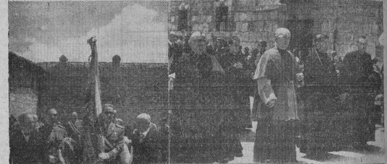
Fiesta del "Curpillos" en Las Huelgas

Con su talento y con su buen sentido, que aunque se diga que es una de las cosas mejor repartida, lo cierto es que en el reparto algunos se han quedado sin nada.