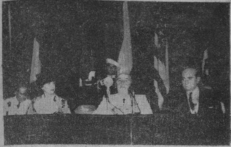
Barcelona. — S. E. el Jefe del Estado acompañado de su esposa y otras personalidades, durante las palabras que pronunció con motivo de la inauguración de dicha Factoría.

"Espero -dijo el Caudillo en un discurso- que rebasados los años de las dificultades y sacrificios, podamos entrar de lleno en los de las grandes realizaciones"