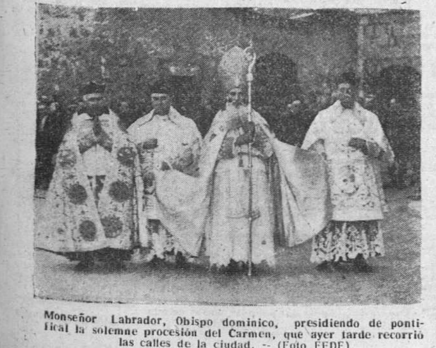
Monseñor Labrador, Obispo dominico, presidiendo de pontifical la solemne procesion del Carmen, que ayer tarde recorrió las calles de la ciudad.