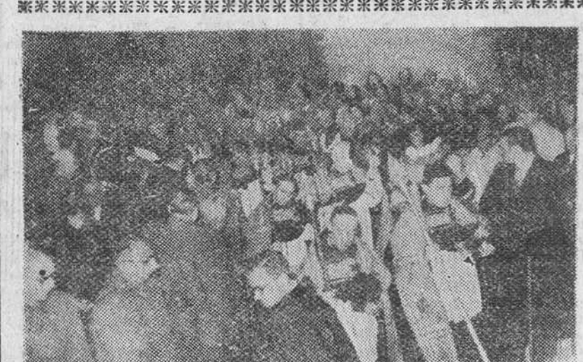
Funerales por el alma del general Yagüe Un momento de las exequias fúnebres que organizadas por las autoridades locales se celebraron ayer en la Catedral, por el eterno descanso del alma del capitán general Yagüe.