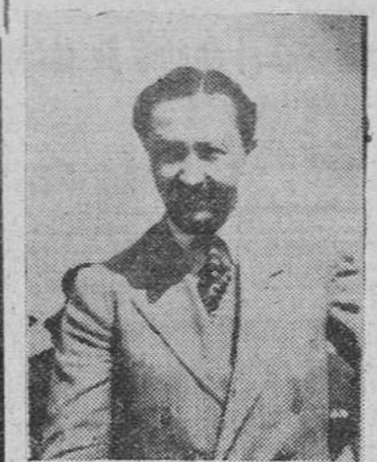
Su Alteza Real el príncipe Abdul Ilah llegará mañana a nuestra Patria y será recibido por Su Excelencia el Jefe del Estado en el aeropuerto de Barajas y...

por el pueblo español en general, con esa especial cordialidad y hospitalidad que caracteriza las relaciones hispano-árabes.