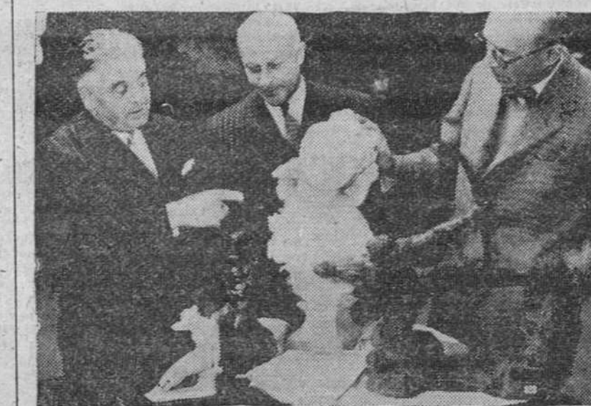
UNA SUBASTA SENSACIONAL. Paris.— La venta en subasta pública de la colección de obras de arte Cognac-Jay, ha sobrepasado los 500 millones de francos. El comisario-tasador y los expertos, examinan las obras maestras de la colección: un bronce de Rodin y un mármol de Carpeaux.

Frankfort.— Las fuerzas armadas norteamericanas en Alemania, realizaron hoy su mayor exhibición desde que terminó la guerra. En varias ciudades de la República federal, se han celebrado desfiles, en los que en total tomaron parte cien mil honores de fuerza de choque y centenares de tanques, cañones y vehículos diversos.—Efe.