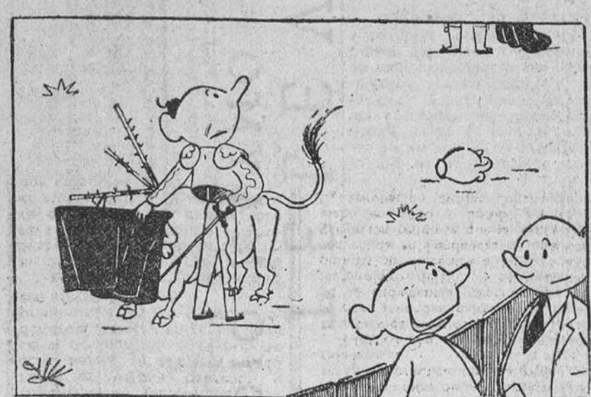
-No sé por qué le llaman «diestro» si torea con la izquierda...