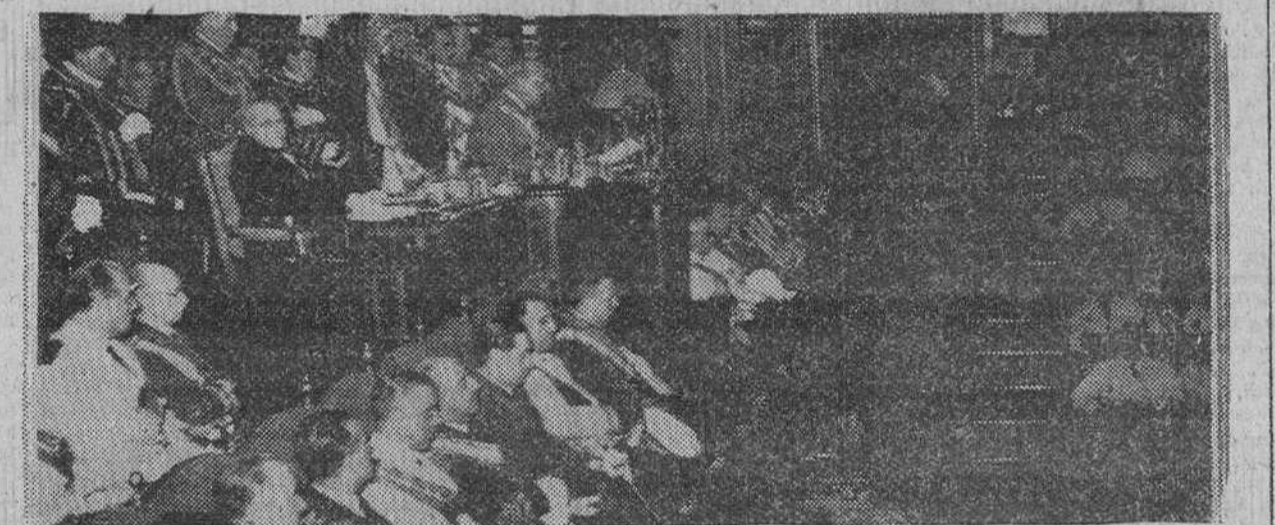
Madrid.— Un momento del discurso pronunciado por S. E. el Jefe del Estado en la sesión de apertura de la nueva etapa legislativa de las Cortes Españolas.