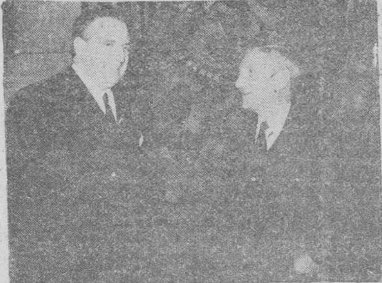
Madrid.—En el Palacio de Santa Cruz, el nuevo embajador de los Estados Unidos en España, Mr. Lincoln Mac Veagh presentó copia de sus cartas de estilo al ministro español de Asuntos Exteriores, señor Martín Artajo.