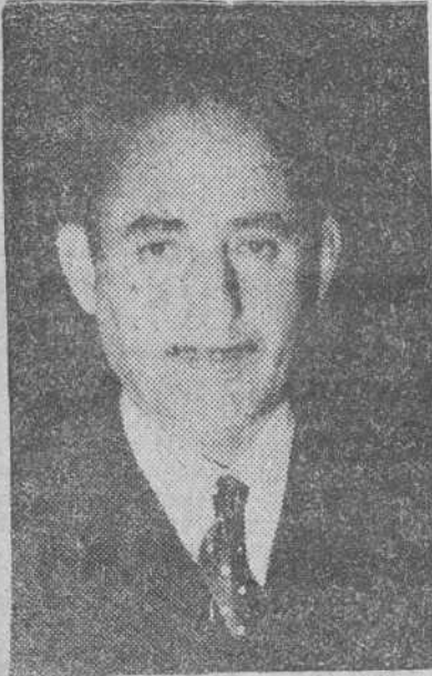
He aquí al general de división Mohamed Ben Mizzian Ben Kassen, que formará parte de la misión designada para acompañar al ministro de Asuntos Exteriores en su visita a los países árabes.