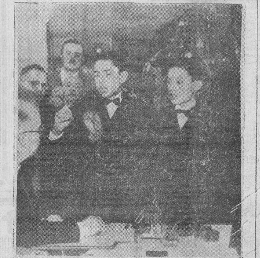
Mañana lunes, dos niños como éstos, del Colegio de San Ildefonso, cantarán la agradable musiquilla de los millores y presentarán el "gordo" de este año a la mesa presidencial

Más de cinco millones de pesetas se llevan recaudadas en Madrid para la campaña de la Navidad de los humildes