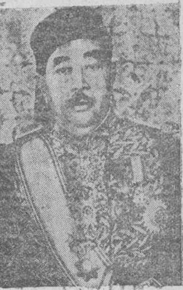
El Bey de Túnez ha nombrado nuevo primer ministro a Sahadidine Baccouche, quien ya ocupó este cargo durante cuatro años, de 1943 a 1947. He aquí una reciente fotografía del político tunecino.