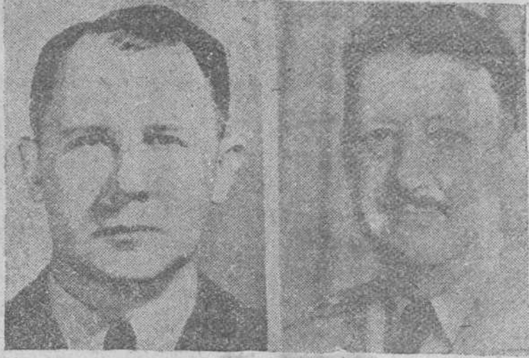
Miembros de la misión norteamericana que en breve visitará Madrid