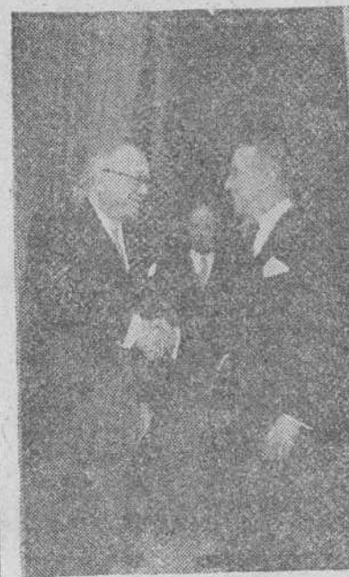
Paris. — El presidente de la República francesa Mr. Vincent Auriol estrecha la mano del nuevo embajador de los Estados Unidos M. James Dunn, quien le presentó sus cartas credenciales. (Foto Gil del Espinar).

La mayor posibilidad de dinero ha contribuido a que la Bolsa se haya mostrado muy firme en sus cotizaciones durante el primer trimestre del año actual, siendo otros tantos éxitos todas las apelaciones que se han hecho al capital, tanto desde el campo oficial como desde la iniciativa privada.