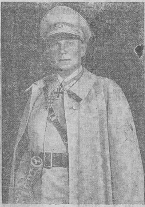
Hermann Goering, Mariscal de Alemania, creador del Ejército del Aire y la Aviación alemana