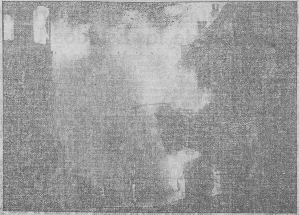
Una calle de Londres después de un bombardeo por la aviación alemana