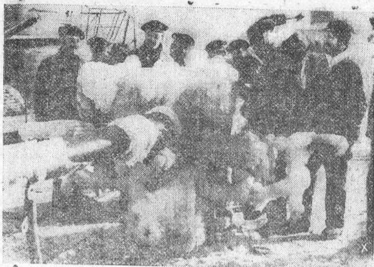
De regreso al puerto, la tripulación de un submarino alemán destruye la costa de hielo formada sobre el sumergible.

APARATO DE RADIO Ha llegado el que muchos esperaban Es magnífico, véalo en LABORATORIO TELE-RADIO Almirante Bonifaz, 19, 2.º