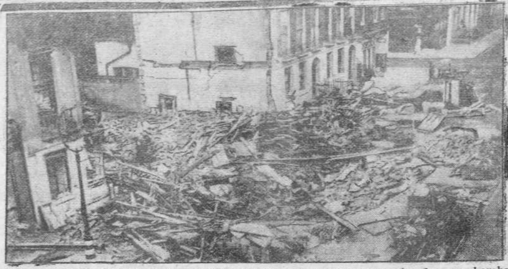
Aspecto que ofreció un centro de aprovisionamiento de Londres después de un bombardeo