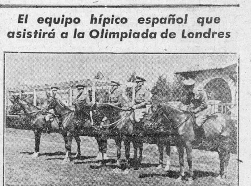
MAÑANA SALDRAN CON DIRECCION A IRUN Y POR FERROARRIL, LOS CABALLOS SELECCIONADOS PARA TOMAR PARTE EN LA OLIMPIADA DE LONDRES. NUESTRA FOTOGRAFIA MUESTRA AL EQUIPO HIPICO QUE SE HA ENTRENADO EN LAS INSTALACIONES DE LA CIUDAD DEPORTIVA DEL DOS DE MAYO.