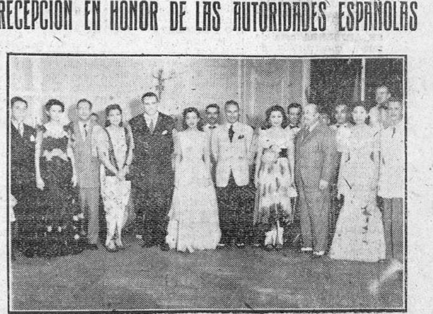
MADRID. — EL MINISTRO DE FILIPINAS ESPAÑA, AL DAR POR CONCLUIDA SU ESTANCIA EN MADRID, HA OFRECIDO UNA BRILLANTE RECEPCION EN HONOR DE LAS AUTORIDADES ESPAÑOLAS. HE AQUI UN DETALLE DEL APTO AL QUE ASISTIERON VARIOS MINISTROS, DIPLOMATICOS Y OTRAS PERSONALIDADES

Madrid.— EL MINISTRO DE FILIPINAS ESPAÑA, AL DAR POR CONCLUIDA SU ESTANCIA EN MADRID, HA OFRECIDO UNA BRILLANTE RECEPCION EN HONOR DE LAS AUTORIDADES ESPAÑOLAS. HE AQUI UN DETALLE DEL APTO AL QUE ASISTIERON VARIOS MINISTROS, DIPLOMATICOS Y OTRAS PERSONALIDADES