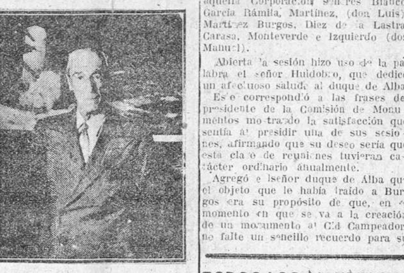
EL DUQUE DE ALBA

Solemne sesión de la Comisión provincial de Monumentos, presidida por el ilustre director de la Real Academia de la Historia