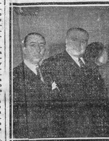
Madrid.—Un momento del homenaje en honor del ilustre escritor Azorin, con asistencia del alcalde de Madrid, presidente de la Real Academia de la Lengua y otras distinguidas personalidades.

Molotov declara que existe la posibilidad de un acuerdo sobre el futuro de Alemania