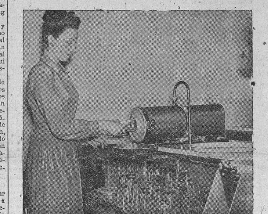
Entre los diversos artículos exhibidos en la Exposición de la industria cervecera, celebrada en Londres, figura este aparato, que puede limpiar mil vasos en una hora. El modelo es reducido, higiénico y económico. La limpieza se efectúa con agua caliente.