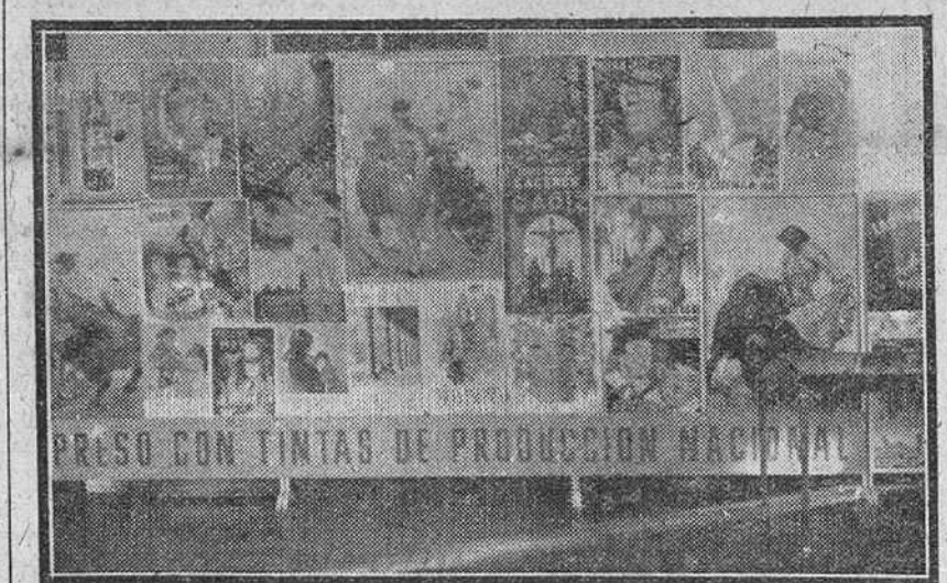
UNA EXPOSICIÓN DE LA CAPACIDAD DE LA INDUSTRIA ESPAÑOLA CON MOTIVO DEL III CONGRESO NACIONAL DE LAS INDUSTRIAS DE LA PINTURA Y AFINES.

Acaba de terminar el año 1947 y durante el nuestra Patria ha continuado industrializándose al ritmo intenso de los anteriores. En esta labor, con tanto éxito efectuada por el Ministerio de Industria y Comercio, ha sido una ayuda inestimable la prestada por el Instituto Nacional de Industria que tiene por misión fundamental definir y realizar los grandes programas de reorganización industrial de nuestra nación, según las normas del Gobierno. El Instituto, aunque entidad estatal, se mueve con la flexibilidad de una empresa privada; respeta la actividad de los particulares y ha conseguido ya en estos momentos éxitos ilustres que repercuten muy favorablemente en la economía nacional. Baste decir que la labor del Instituto Nacional de Industria y de las empresas en las que tiene invertido capital, va desde la producción de combustibles sólidos y líquidos, a los fertilizantes y las producciones metalúrgicas, así como transportes de todas clases. Solamente en lo que a metales ligeros se refiere, especialmente el aluminio, se aborranán al año en importaciones unos seis millones y medio de toneladas. Hasta el momento el Instituto está interesado en empresas cuyo total de envolvimento supere unos 4.500 millones de pesetas. Tal vez la más importante de todas sea la Empresa Nacional Calvo Sotelo, a la que corresponden unos 2.000 millones de la cifra citada, y que tiene por misión la producción de combustibles líquidos y fertilizantes. Los desembolsos efectivos del Instituto