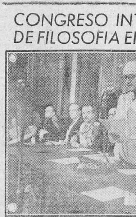
Barcelona.—Momento del trascendental discurso pronunciado por el ministro de Educación Nacional Sr. Ibañez Martín, con motivo de la sesión inaugural del Congreso Internacional de Filosofía, al que asisten delegados de Portugal, Argentina, Colombia, Estados Unidos, Francia, Italia y otros países.