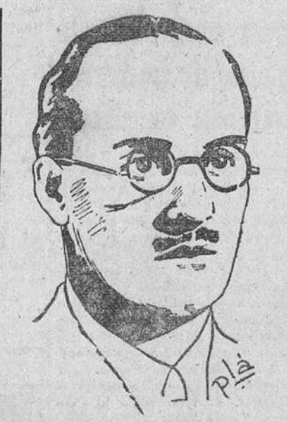
Sr. IBAÑEZ MARTIN