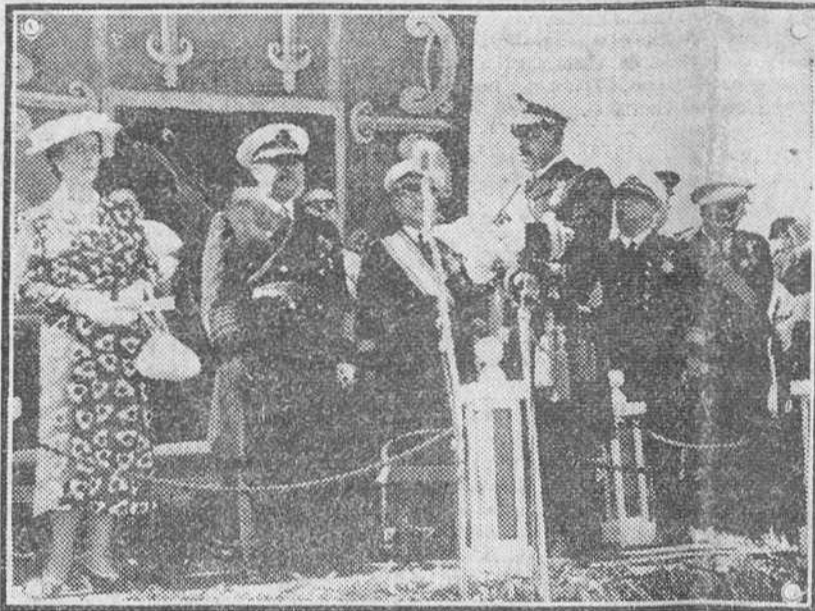
Huelva. — El ministro de Marina, Almirante Regalado, lee la ofrenda de los emblemas de Almirante Mayor de Castilla a S. E. el jefe del Estado.

La ciudad amaneció engalanada. En (Pasa a cuarta página)