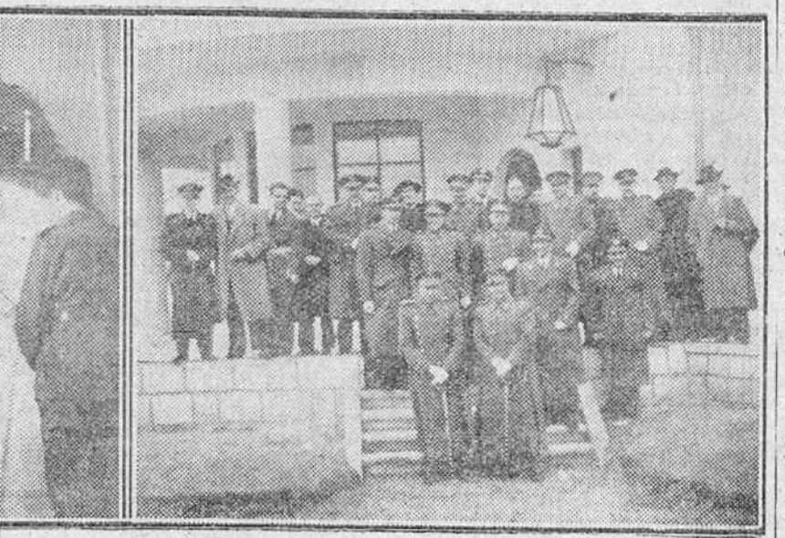
Ayer conmemoró el Ejército del Aire la festividad de su excelsa Patrona, Nuestra Señora de Loreto. En el campo de Villafria se celebró una solemne misa, presidida por las autoridades. En nuestros grabados, un momento de la ceremonia religiosa y un grupo de concurrentes a la fiesta.