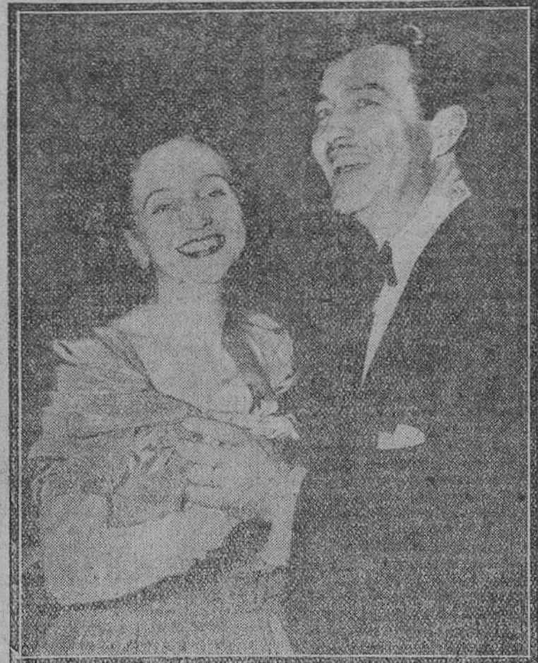
Más Margaret Truman, hija del presidente de los Estados Unidos, ha sido sorprendida por el fotógrafo bailando con el famoso actor de la pantalla, Robert Taylor, en una reciente fiesta celebrada con fines benéficos y en la que la señorita Truman --que posee una cálida y bien timbrada voz-- interpretó --con éxito, naturalmente-- varias canciones.