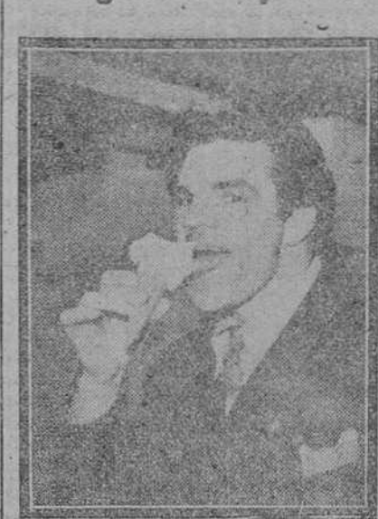
El pugil inglés, Freddie Mills, campeón de Europa de los pesos semipesados, que continúa detentando su título después de su victoria sobre Paco Bueno

Londres.— Hoy se celebrará en el estadio de Harringay una velada extraordinaria de boxeo, en la que se disputará el título europeo de los semipesados, entre Freddie Mills y Paco Bueno.