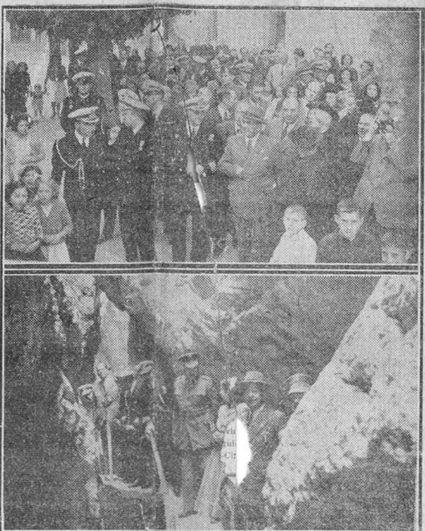
LOS ACTOS DE HOMENAJE DE BURGOS A LA MARINA.— En nuestra fotografía el ministro de Marina, durante su visita a Covarrubias y en visita a un detalle de la procesión en el templo de Silos y un grupo de niños bajo el admirable cielo de Burgos silense.—(Fotos de la tarde).

Los actos de homenaje de Burgos a la Marina.— En nuestra fotografía el ministro de Marina, durante su visita a Covarrubias y en visita a un detalle de la procesión en el templo de Silos y un grupo de niños bajo el admirable cielo de Burgos silense.—(Fotos de la tarde).