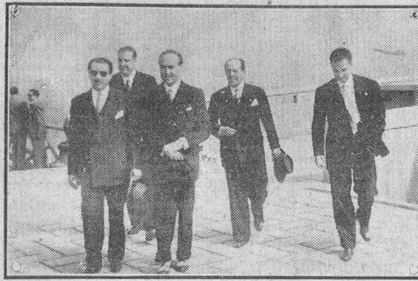
San Sebastián.— El Sr. Montanaro, embajador del ministro de Asuntos Exteriores español, en la Argentina, subsecretario de Asuntos Exteriores paraguayo y el alcalde de la ciudad, durante su visita al momento de su salida.

A continuación, después de señalar en que consiste la prórroga del pacto, "A Voz", añade: "Desgraciadamente los hechos ocurridos después de la última guerra mundial exponen principalmente y lo que desde el día de la victoria ha ido sucediendo en el Mundo y que hoy trae a la humanidad en sobresalto, cada vez más angustioso, demuestran que Portugal y España tenían razón y habían prevenido todo. Este pacto de amistad y estos acuerdos de mutua defensa, es cada vez más necesario".