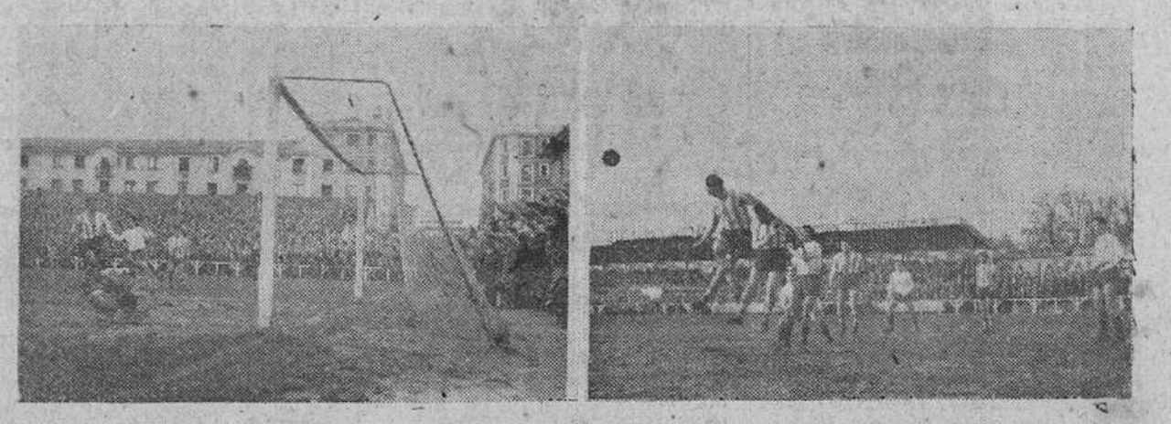
A la izquierda, momento de producirse el primer gol del Burgos, que suponía el empate para el equipo rojiblanco. A la derecha, dos defensas zamoranes se anticipan con contundencia a Torres Pardo y Rojo y despejan un balón de su área.

Finalmente, si bien es verdad que consideramos sólida y contundente la línea defensiva.—Orive flojeó esta vez— nos permitimos aconsejar a sus componentes que eviten cualquier desplazamiento arriesgado de su demarcación, el reírse y hasta casi dírmanos el intentar el regate dentro de ella con peligro evidente como el que asimismo constituyen, en la ma-