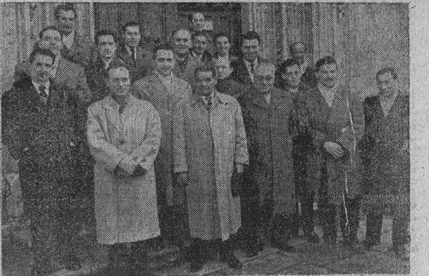
En esta ocasión se invirtieron los términos y los fotógrafos burgaleses, que conmemoraron el domingo con diversos actos su fiesta patronal de La Verónica, posaron para "Fede", a la salida de la Misa celebrada en la histórica Cartuja de Santa María de Miraflores.

Denunció las amenazas soviéticas contra el Japon y dijo que tales amenazas demostraban la necesidad de una alianza defensiva anticomunista.—Efe.