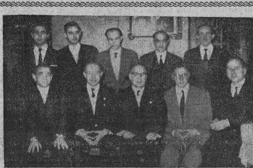
La nueva Junta directiva del "Círculo de la Unión" Los componentes de la nueva junta directiva de la Sociedad "Círculo de la Unión" fotografiados en la noche del sábado, con motivo de la tradicional cena de directivos, que tuvo lugar en el domicilio social.