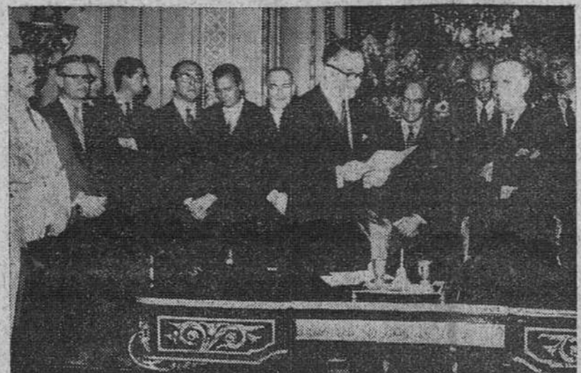
La nueva Junta directiva del "Círculo de la Unión" Los componentes de la nueva junta directiva de la Sociedad "Círculo de la Unión" fotografiados en la noche del sábado, con motivo de la tradicional cena de directivos, que tuvo lugar en el domicilio social.