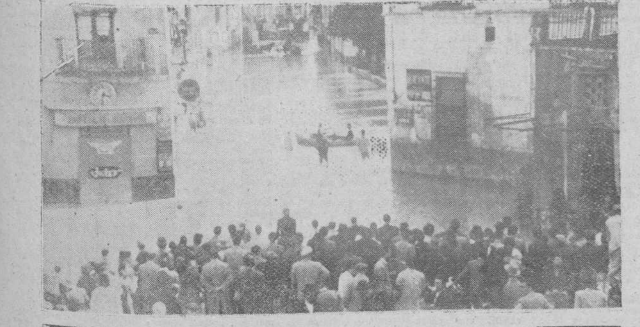
Orihuela. — Las aguas desbordadas del río Segura inundaron varias calles de esta ciudad. En la foto aparece un grupo de personas contemplando los trabajos de evacuación de las personas aisladas por las aguas.