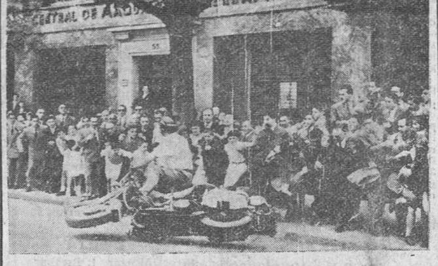
Bilbao.— "Cecilio", el popular redactor gráfico, captó el primer momento de un apuro choque entre dos motoristas, participantes en el Rallye Automovilístico bilbaíno. Por fortuna no hubo que lamentar más que algunos heridos leves, entre el público.— (F. Cifra)