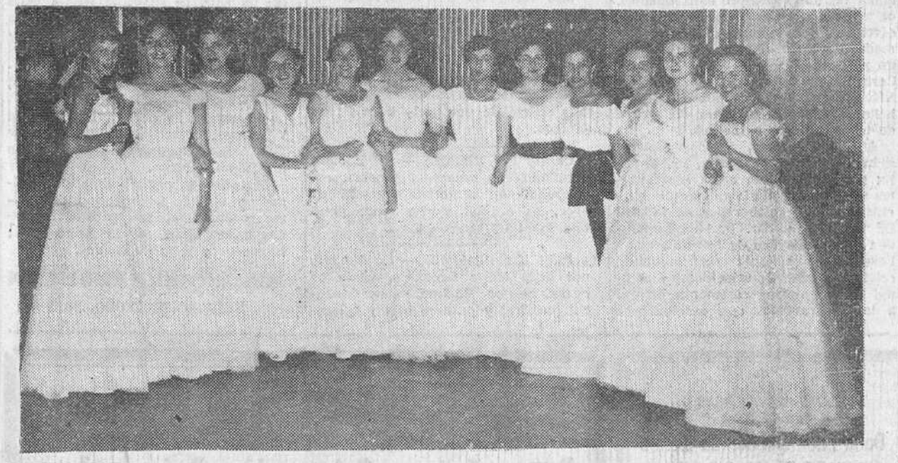
Un grupo de bellas y distinguidas señoritas concurrentes al brillantísimo baile de gala, celebrado anteanoche, según es tradición, en la Sociedad "Salón de Recreo", con motivo de las ferias de San Pedro y San Pablo.