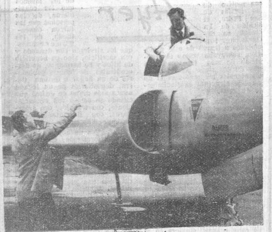
Londres. — El piloto Michael Lithgon, en el momento de tripular su aparato, para establecer el récord aéreo, Londres-Paris, en 19 minutos y 41 segundos.