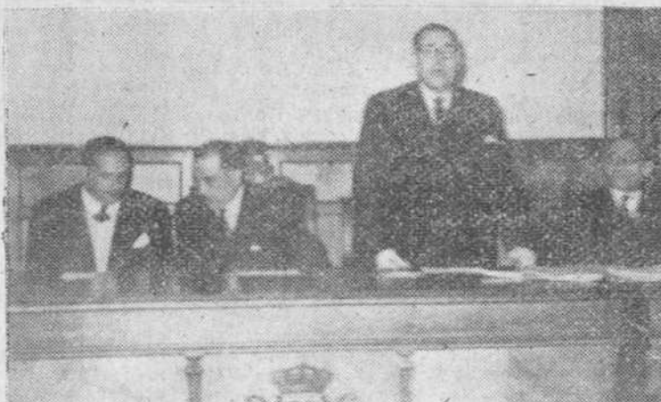
Celebraron ayer su fiesta los doctores y licenciados en Filosofía y Letras y Ciencias de nuestra ciudad. En nuestro grabado se recoge un momento del acto cultural, celebrado en la Diputación. — (Foto Fede).