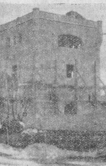
Perspectiva que ofrece la torre donde se exhibirán los productos típicos burgaleses, en la próxima Feria Internacional del Campo.