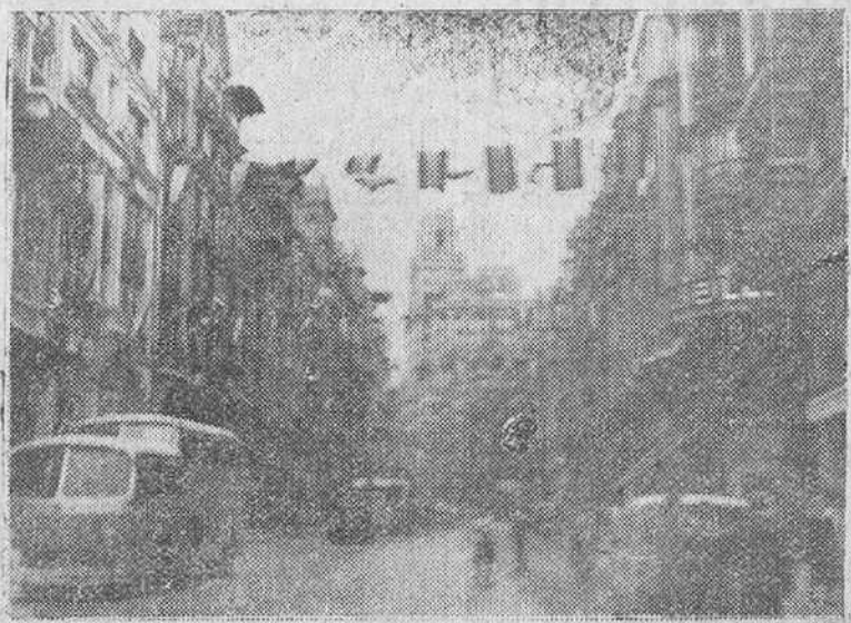
La capital de España ha engalanado sus calles y plazas, para recibir al presidente de la República portuguesa, que hoy llegará a la capital de España. He aquí un aspecto de la Avenida de José Antonio, en la que flamean las banderas portuguesa y española. — (Foto Gil del Espinar).