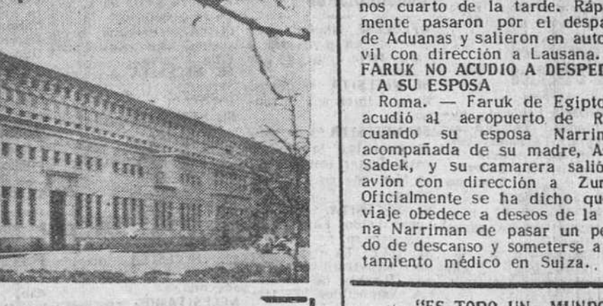
NUOVO CENTRO UNIVERSITARIO Paris. — En Bourges ha sido inaugurado por el ministro francés de Educación Nacional, este magnífico edificio, destinado a residencia femenina, con capacidad para 300 estudiantes y que servirá de internado para los universitarios extranjeros que acuden a París durante las vacaciones.

«ES TODO UN MUNDO EL QUE HAY QUE REHACER URGENTEMENTE DESDE SUS CIEMIENTOS». Pío XII El Seminarista, futuro sacerdote de Cristo es la esperanza de una edad mejor. El Seminario, la raíz del bien