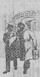
HOMBRES DE NEGOCIOS

Sean quienes sean, BOAC está especializada en tratar a toda clase de pasajeros. Ofreciéndoles siempre la seguridad primero, con sus aviones ultramodernos, en unos servicios más rápidos les garantiza un viaje cómodo y tranquilo. Viaje usted tranquilo sin ninguna preocupación, como pueden estar tranquilos los que permanecen en tierra, tanto en el lugar de embarque como en el punto de destino, porque