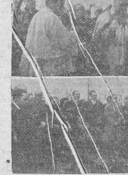
En nuestro reportaje gráfico de "Fede" puede apreciarse dos momentos de la iniciación de las obras de la Casa de Ejercicios de Burgos sobre terrenos de la Casa de Venerables. Arriba, el Prelado de la Diócesis Doctor Pérez Platero bendice la primera piedra y abajo, un grupo de autoridades y representaciones concurrentes a la ceremonia