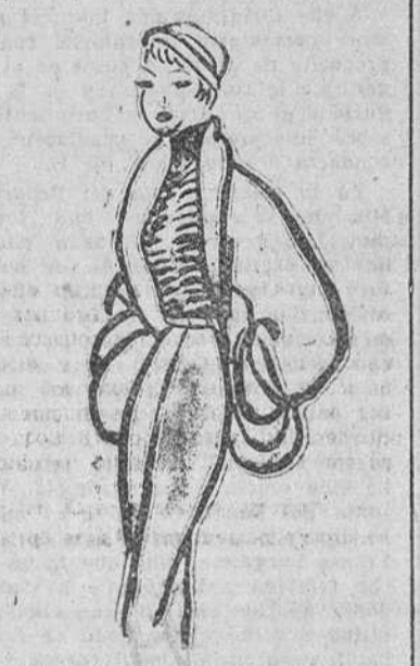
Vestido sastré azul marino. Con blusa gris.—Creación Mangun

Las exigencias del oficio.—Una de las más célebres compradoras de modelos de América, estaba presentando el desfile de la colección de Greta, que es una de las más bellas de esta primavera, cuando la remitieron un cablegrama diciendo que su esposo acababa de fallecer en Nueva York.