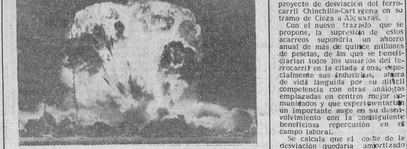
EXPLOSION ATOMICA Desierto de Nevada. — Esta fotografía ha sido tomada a mil metros de distancia, del lugar donde hizo la explosión la bomba atómica y da idea muy pequeña de lo que en realidad es el efecto devastador de la explosión.

Visita del ministro de Obras Públicas al monasterio de Guadalupe