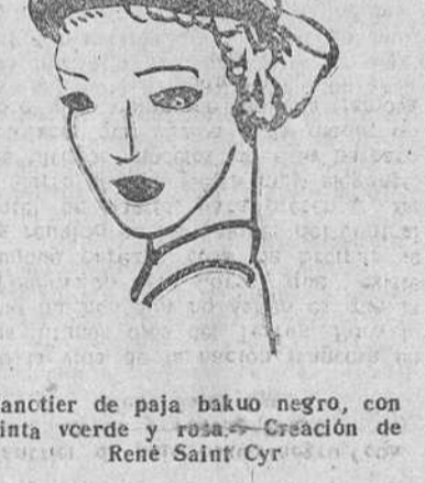
Canthier de paja bako negro, con cinta verde y rosa.—Creación de René Saint-Cyr

PARIS. Manzo.—(Exclusivo para nuestro periódico).—Todo el que se interesa por la Historia conoce, aunque no sepa muchas veces de que se trata, ese famoso edicto que tanto influyó