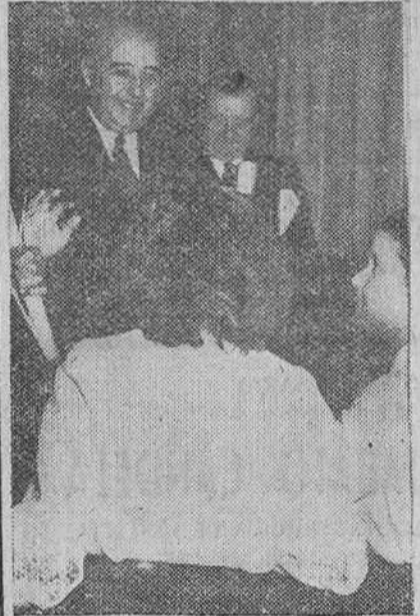
Madrid.—S. E. el Jefe del Estado, recibió en su palacio de El Pardo, al grupo coral de Crevillente (Alicante), que le hizo ofrenda de canciones y palmas de Semana Santa.