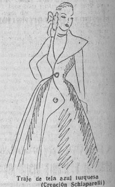
Traje de tela azul turquesa (Creación Schisparelli)

Dominando su dolor, continuó eligiendo sus modelos, y después siguió su visita en otra casa de la rue de la Paix, en donde tenía que dar algunas órdenes para que le terminaran los modelos pedidos. Y cuatro días después, estaba de vuelta en París procedente de Norteamérica, para continuar sus interrumpidas compras. Esto nos hace pensar en los actores, que continúan en escena después de haber muerto un ser querido, y prosiguen fingiendo su papel hasta que cae el telón. Ridi, Pagliacci... Pero ésta es la vida de los que se consagra a un ideal de arte o de elegancia, y a veces la preciosa elegancia consiste en saber reprimir las lágrimas. Lineas a la moda.—Hemos anotado estas últimas líneas: Línea "Cometa", línea "Escapada", línea "Quilpan", línea "Escarillo"... (Cartas líneas que, al final, terminan todas en curvas) (Prohibida la reproducción).