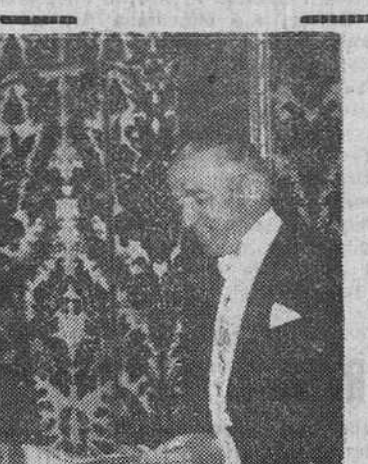
Madrid.—S. E. el Jefe del Estado, acompañado del ministro de Asuntos Exteriores y de los jefes de su Casa civil, recibe en el Palacio de Oriente, las cartas credenciales del nuevo embajador de los Estados Unidos, Mr. James C. Dunn.