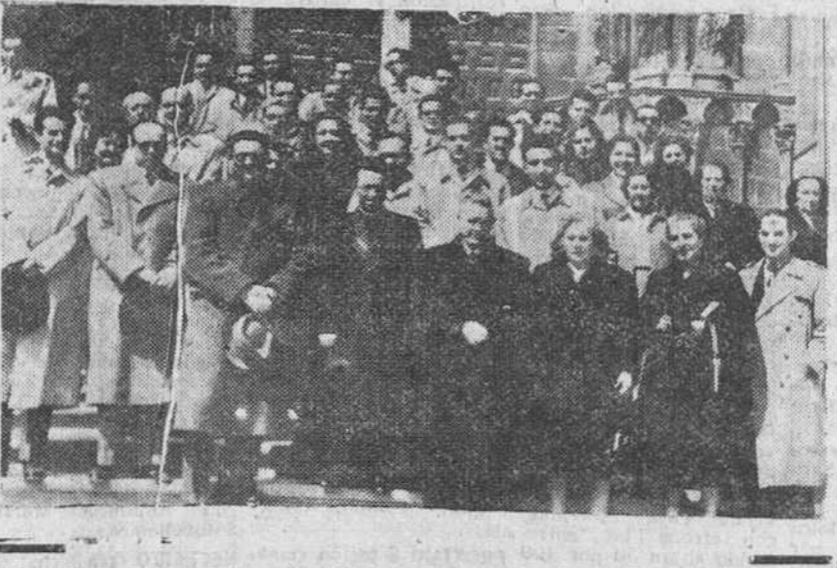
La fiesta de San Isidoro. Los funcionarios de los Institutos Nacional de Estadística y Geográfico y Catastral, celebraron ayer la fiesta de su Patrono, San Isidoro, Obispo de Sevilla. En la fotografía aparece un grupo de dichos funcionarios, después de asistir a la misa celebrada en la S. I. Catedral

En la sesión de clausura fueron leídas las conclusiones redactadas sobre cada uno de los temas propuestos y después, el director general de Enseñanza Laboral, señor Rodríguez de Valcárcel, que presidió el acto, pronunció un discurso de clausura, en el que destacó la necesidad de proseguir sin descanso la labor emprendida para que la enseñanza laboral alcance las metas culturales y sociales perseguidas por la enseñanza laboral.