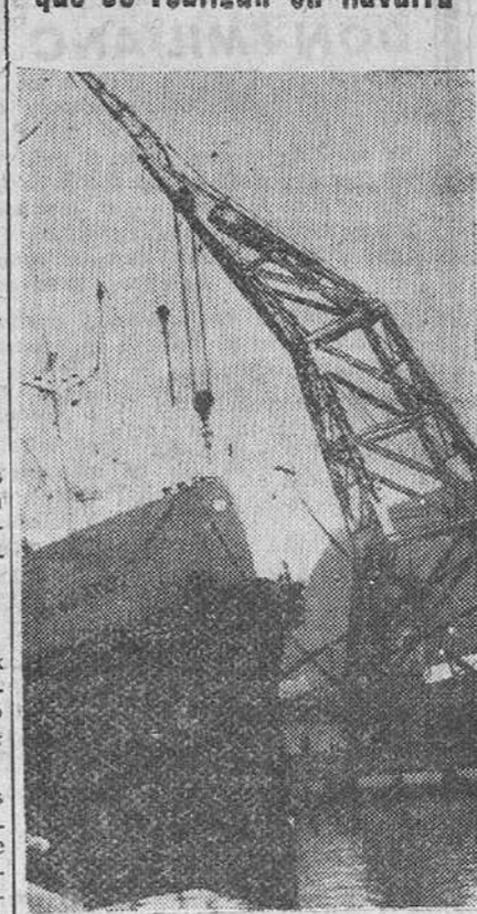
Bilbao.—Las grúas del puerto, mas la cabria, de cien toneladas, de la Junta de Obras proceden a descargar del vapor "Mar Adriático" la maquinaria llegada para los sondeos petrolíferos que se realizan en Navarra