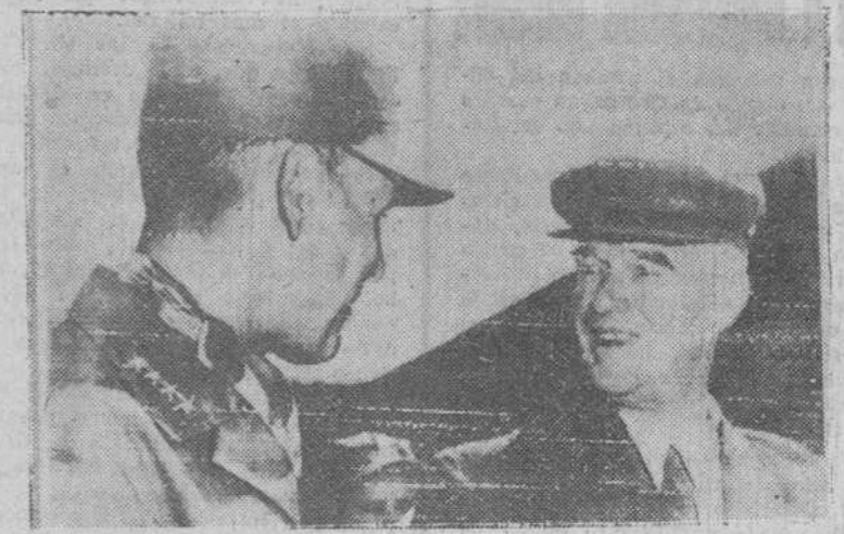
Pannunjon. — El general norteamericano William Dean (a la derecha), es felicitado por el general Maxwell D. Taylor, al ser canjeado por los comunistas en la "aldeña de la libertad".