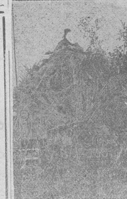
He aquí un carro blindado alemán que avanza completamente camuflado ante la vista de los aviones enemigos