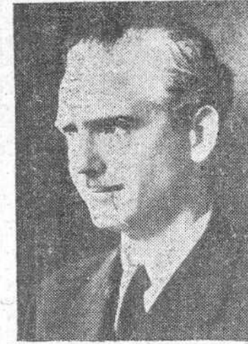
Turin.—A las 2,50 de la tarde ha llegado, procedente de París, el ministro de Asuntos Exteriores de España, don Ramón Serrano Suñer. Le acompañaba el emba-

En Liorno, donde fué objeto de una entusiástica manifestación de simpatía, le esperaba el conde Ciano