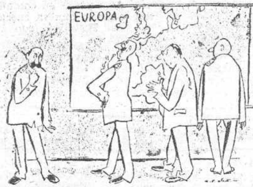
CONVERSACIONES REFERENTES A LA INVASION EN WASHINGTON —Entonces, general, ¿dónde quiere usted desembarcar con sus tropas? —Si puedo escogerlo ¡en el Brasil! "Das Reich", Berlín.