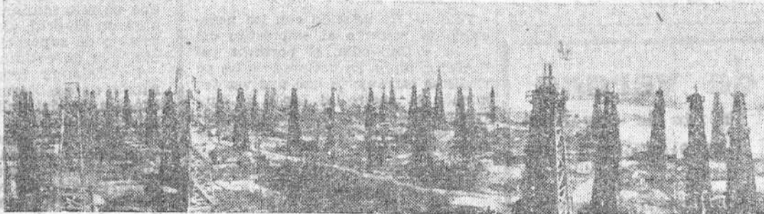
Pozos de petróleo de Bakú en la Circuasia

Uno de los Jefes alemanes de la última guerra, el célebre general Ludendorf, muerto en Munich el 20 de Diciembre de 1933, decía al final de aquella contienda: "Si Alemania hubiera dispuesto del petróleo de Bakú, hubiera sido in-