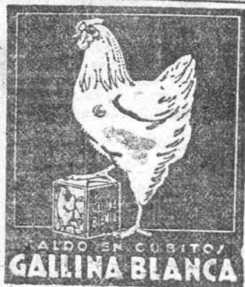
ALDO EN CUBITO / GALLINA BLANCA

Vendo casa en San Pedro de la Fuente produciendo el 5 por 100; los mejores solares y una tierra a orilla de carretera muy barata. Compra venta Fincas Sáenz de Santa María Avellanos, 1 duplicado.